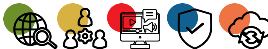
Tableau de synthèse par compétence