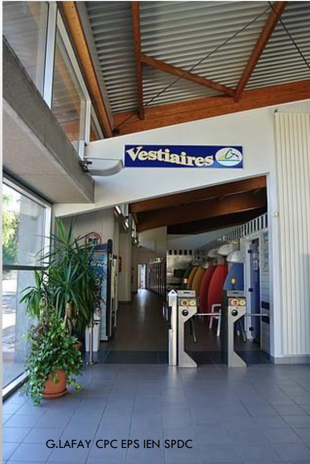
G.LAFAY CPC EPS IEN SPDC