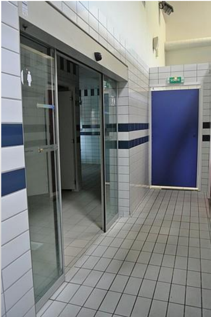
G.LAFAY CPC EPS IEN SPDC