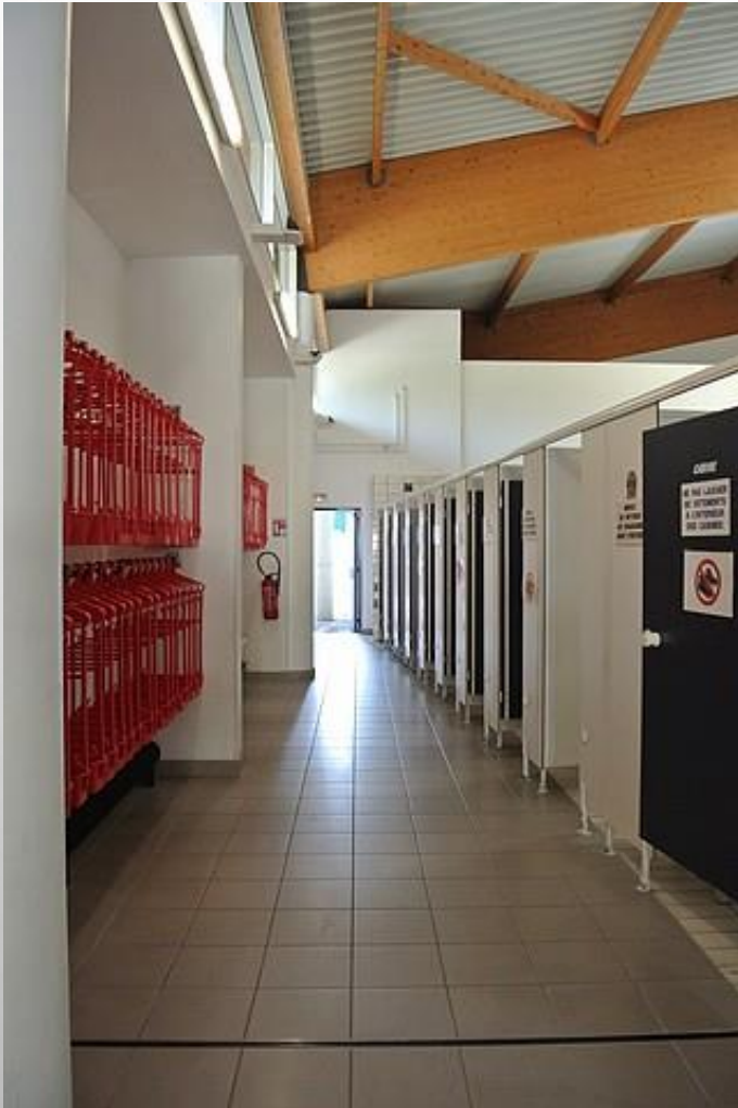
G.LAFAY CPC EPS IEN SPDC