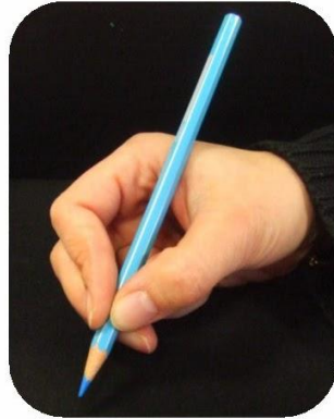
Le crayon est posé sur la première phalange du majeur.