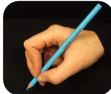
Le haut du crayon est posé dans le creux entre le pouce et l'index.