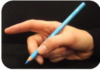
Ce n'est pas l'index qui pince, il dirige.